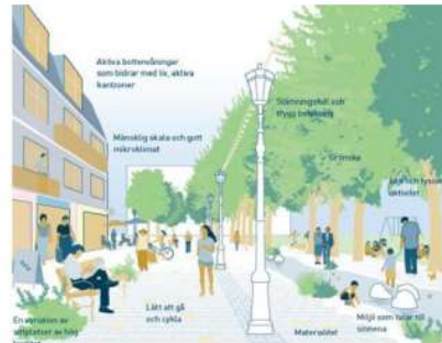
Hur hanteras utrymning från bostäderna i denna illustration?

genom fönster. Det innebär att det måste vara möjligt att ställa upp höjdfordon i anslutning till byggnaden. Ökas grönska måste därmed placeras utifrån vad som är möjligt för att säkerställa de boendes säkerhet. Samma princip gäller även för andra installationer i gaturummet.