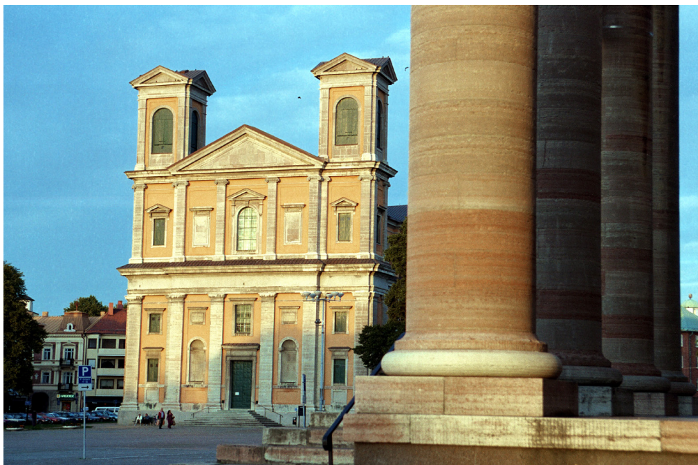
Bild 4. Fredrikskyrkan

Arrangören avser att förhandla med förslagsställarna av vinnande förslag om uppdraget att projektera/ta fram fullständiga arkitekthandlingar för kulturhuset. Finner arrangören skäl att frångå juryns rekommendation skall samråd ske med Sveriges Arkitekter.