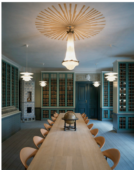
Bild 1. Läsesällskapets bibliotek

Möbler och fast inredning ska monteras ned och tas med in i kulturhuset där en ny miljö ska byggas upp för såväl samling som interiör där den blir mer åtkomlig för besökare än vad den är idag.