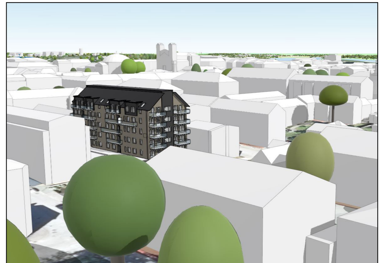
Bild 4. Perspektiv över föreslagen bebyggelse sett från sydväst.