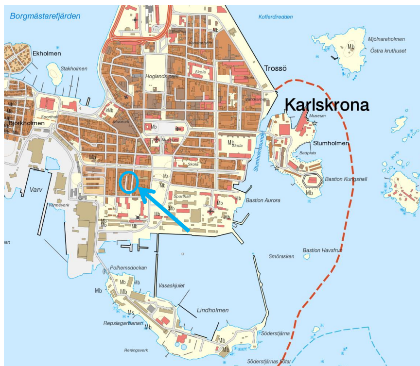
Figur 1. Blå markeringar visar det berörda områdets placering.

Det berörda området ligger på Trossö i Karlskrona, se figur 1. Idag utgörs området av en gräsyta. Området begränsas i norr och väster av bostadsfastigheter, i öster av vägen Finnagränd samt i söder av en stor mur (Slutningsmuren).