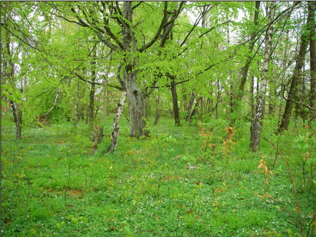
Möjligt boplatsläge inom planområdet, se skraffering bilaga 1.