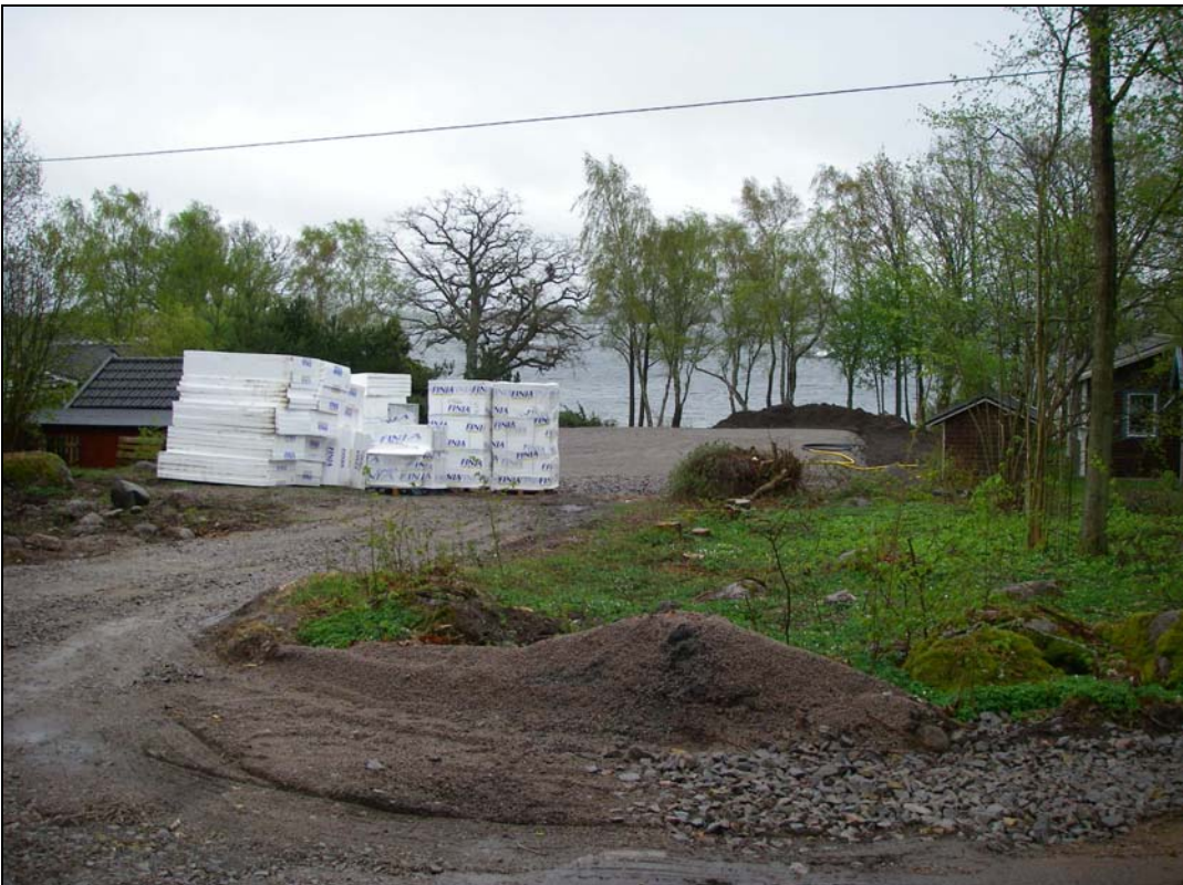
Pågående byggnation i strandnära terräng.