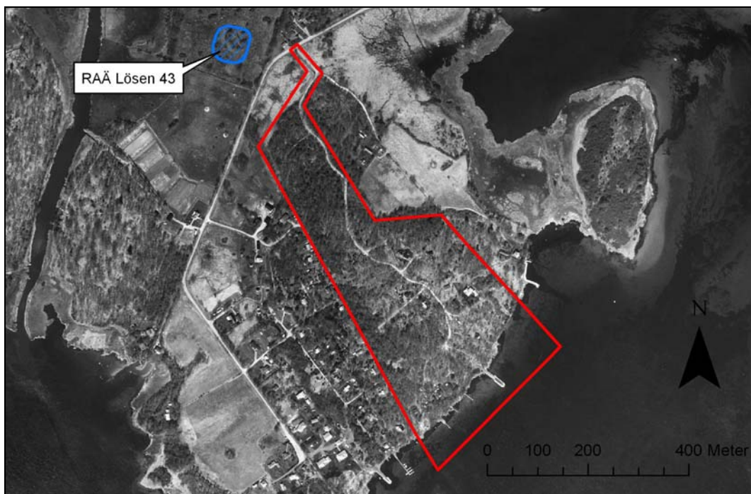
Fig.1 – Utredningsområdet markerat på ortofoto.

Inför planerad nybyggnation av ett drygt 20-tal enbostadshus inom fastigheten Torstäva 13:25 uppdrog länsstyrelsen åt Blekinge museum att vidare utreda den antikvariska situationen inom planområdet. Läns museet utförde av denna anledning en särskild utredning i form av en övergripande kulturmiljöutredning inom området. Föreliggande avrapportering utgör en redovisning av det utförda uppdraget, vilket bekostats av exploatören.