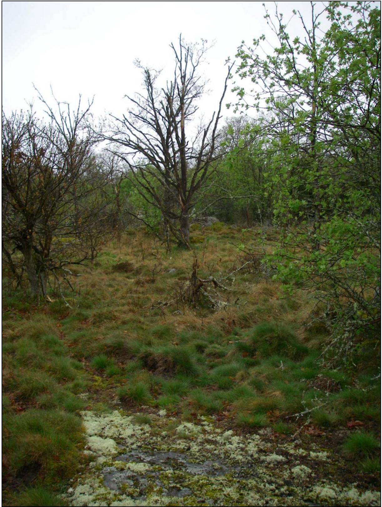
Miljöbild från planområdets norra del.