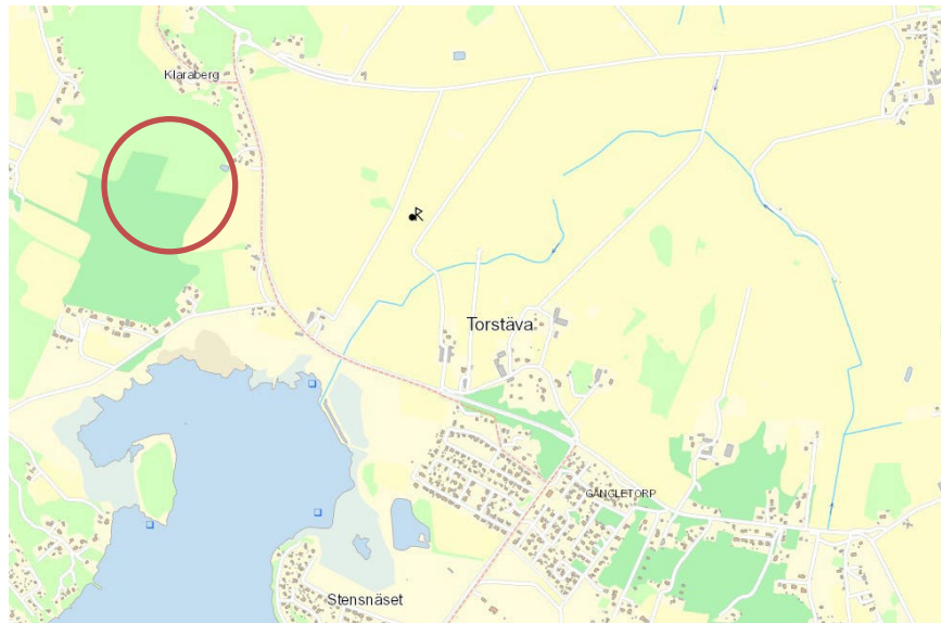
Bild 1. Översiktskarta med planområdets ungefärliga läge

Planområdet omfattar fastigheterna Torstäva 13:33, Torstäva 12:13, Öljersjö 8:44 samt Öjersjö 2:28. Området är ungefär 43 ha till ytan och ligger strax söder om Sturkö rondellen längs med Gängletorpsvägen. Området består till största del av skogsmark varav delar är produktionsskog. Delar av marken är åkermark.