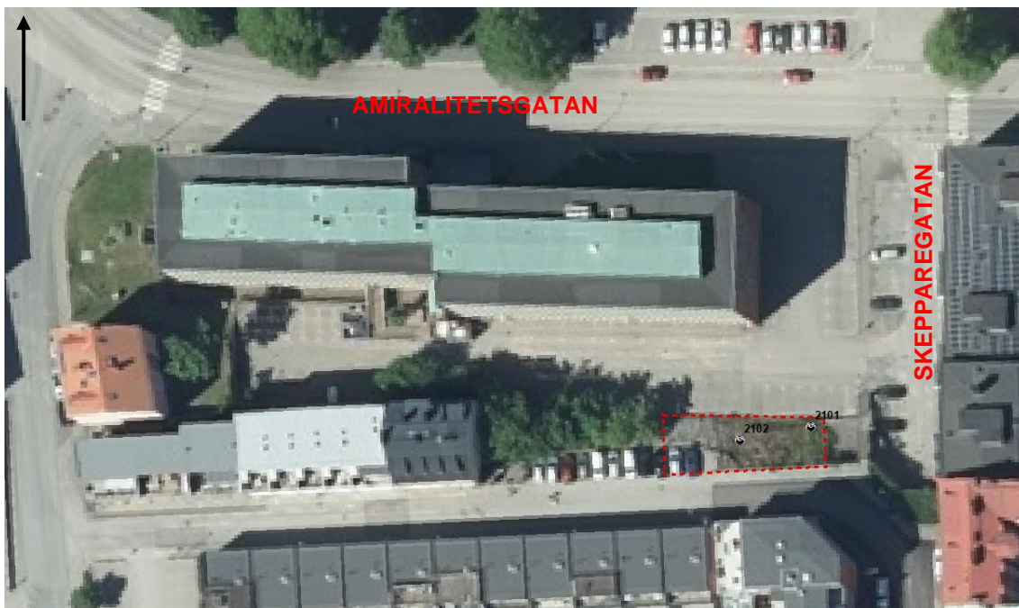
Figur 3. Provtagning har utförts i två provpunkter (2101 och 2102) på fastigheten Pollux 43.

Provtagningen har utförts för hand med ett spadborr (Figur 4). Provtagning utfördes ner till ca en meter under släntens överyta och utefter geologisk enhet. Vid provtagningsstillfället dokumenterades jordlagerföljder, lukt och synintryck. Prover har uttagits i diffusionstäta plastpåsar och förvaras kylt fram till laboratorium.