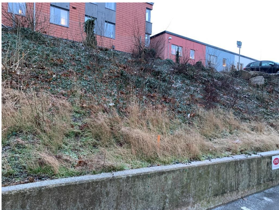
Figur 2. Fastigheten Pollux 43 utgörs av en delvis grusad, delvis buskbeväxt slänt.

På fastigheten finns det planer på att uppföra ett flerbostadshus.