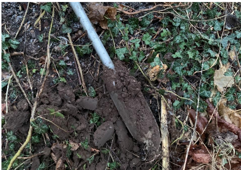
Figur 4. Provtagning har utförts med hjälp av ett spadborr.

Provtagningen har utförts för hand med ett spadborr (Figur 4). Provtagning utfördes ner till ca en meter under släntens överyta och utefter geologisk enhet. Vid provtagningsstillfället dokumenterades jordlagerföljder, lukt och synintryck. Prover har uttagits i diffusionstäta plastpåsar och förvaras kylt fram till laboratorium.