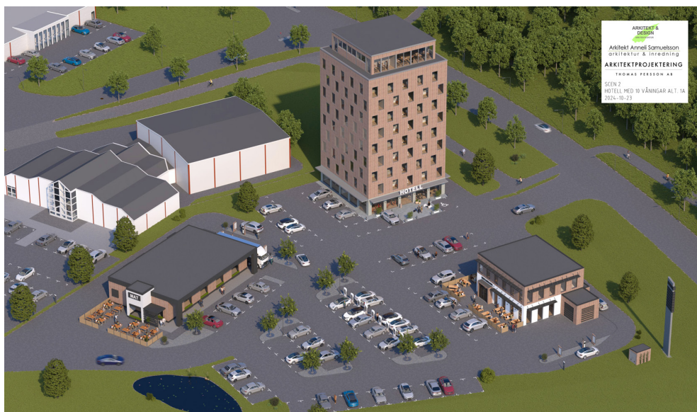
Bild 2-4. Volymstudier för planförslaget.