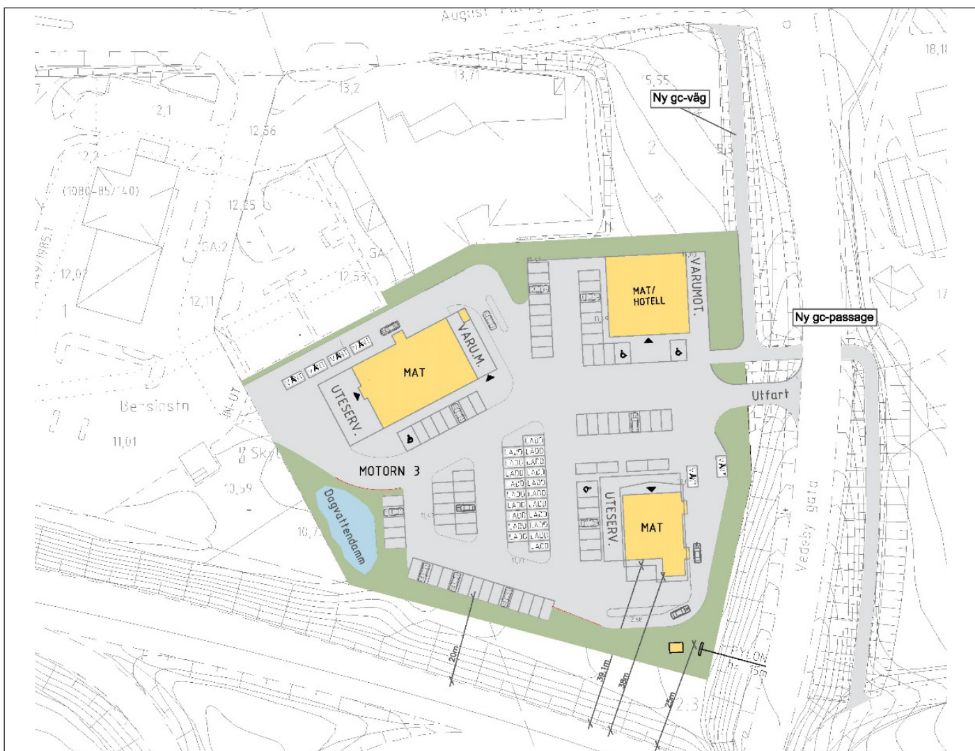
Bild 6. Illustrationsplan över planområdet.