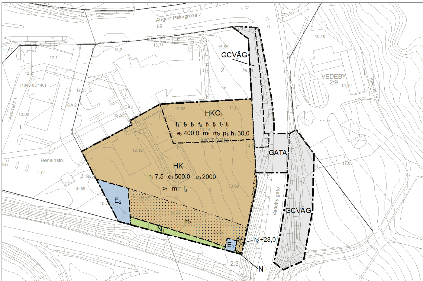
Bild 5. Utdrag från förslag till plankarta.