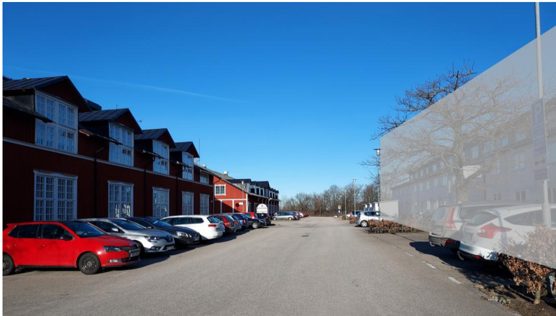
Fig. 13. Öppet stråk mellan Grenadjären 57 och Skillingarydbarackerna, vy mot norr. Infogat finns en enkel och ungefärlig markering av föreslagen byggnation, vilket delvis förtätar gaturummet.