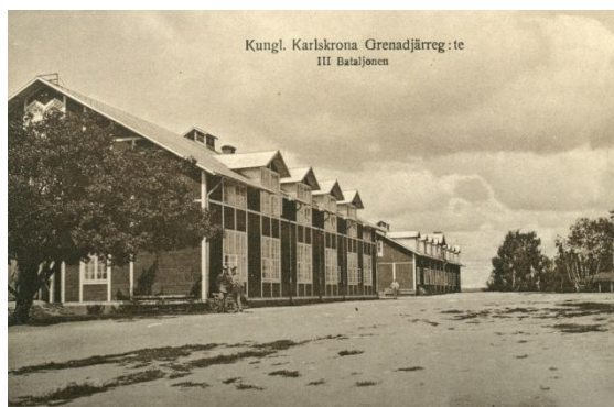
Fig. 3. Grenadjärregementet på 1910-talet, enligt häradskartan. Byggnader inringade med rosa linje är de byggnader som idag är kulturmiljöskyddade i gällande detaljplaner. Fig. 4. De s.k. Skillingaryd-barackerna, 1920-talet. Eken vid gaveln till vänster finns ännu kvar.