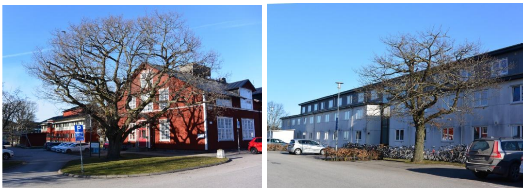
Fig. 9. Södra gaveln på den södra baracken. Jämför fig. 4. Fig. 10. Nuvarande byggnad uppförd år 2010 har likt föregångaren ett anspråkslöst yttre. Den solitära eken utgör ett blickfång.