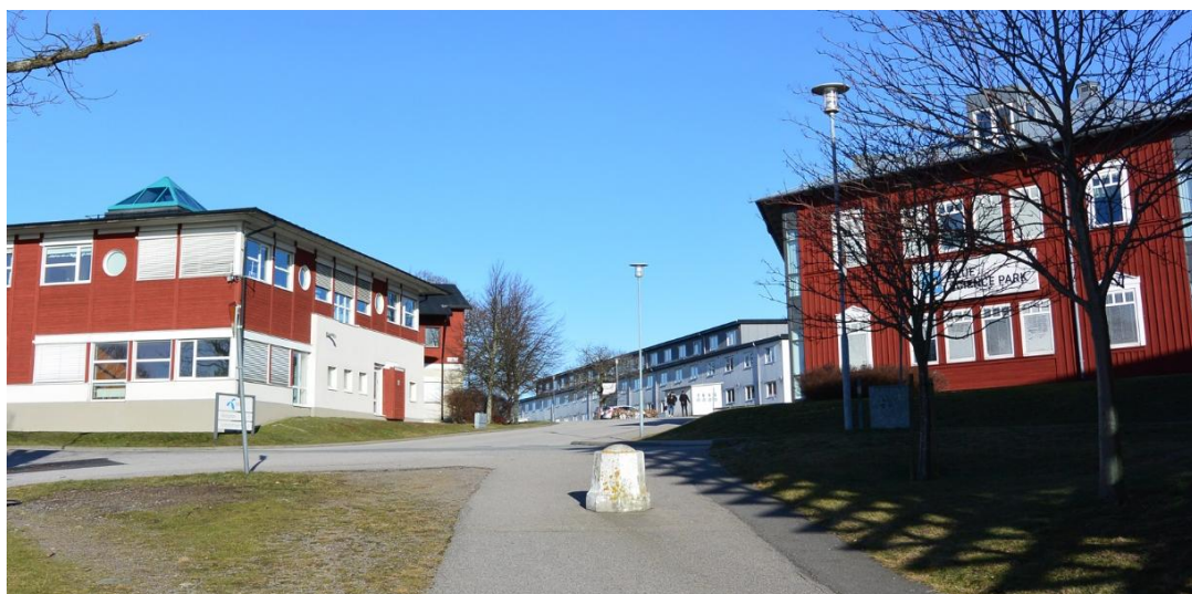
Fig. 11. Vy mot Grenadjären 57 med lågmäld och underordnad framtoning. Byggnaderna i förgrunden är inspirerade av områdets traditionella, rödfärgade bebyggelse. Den smala gångvägen i bildens mitt utgör ett av de äldre stråken i området.