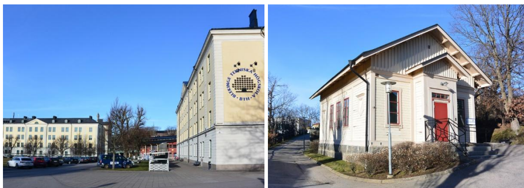
Fig. 1. De f.d. kasernbyggnaderna i södra delen av området. Fig. 2. Den lilla träbyggnaden påminner om ett kapell, men var ursprungligen gevärssmedja.

En markant skillnad märks mot den södra delen av Gräsvik, som karakteriseras av öppna ytor och framträdande klassicistiskt utformade kasernbyggnader med gulputsade fasader (två stycken, med tillhörande kanslihus, fig. 1). Enstaka mindre byggnader med ljusa träfasader, från det tidiga 1900-talet, finns även inpassade bakom kasernklustret (fig. 2). Kontrasten mellan de sammanhållna karaktärsbyggnaderna på södra delen av området och de mer spridda ”funktionsbyggnaderna” på norra området är – och har alltid varit – stor. Denna kontrastverkan bedöms som viktig ur ett såväl upplevelsemässigt som pedagogiskt och bebyggelsehistoriskt perspektiv.