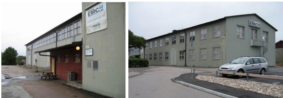
Fig. 7 och 8. Del av mekanikerskolan år 2005, som utgör föregångaren till den nuvarande byggnaden inom aktuellt planområde.