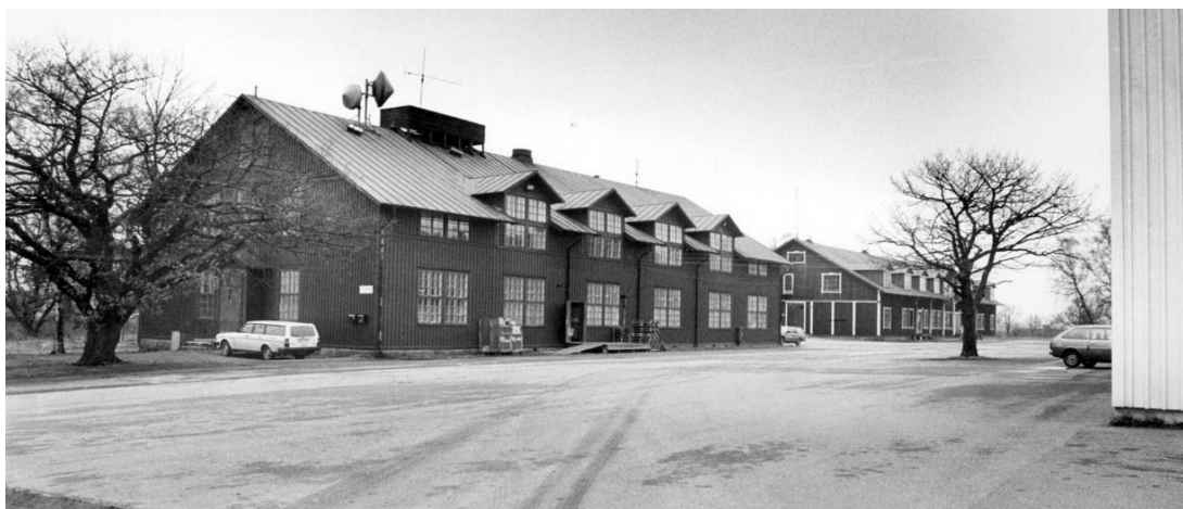
Fig. 12. Den öppna och rymliga ytan med enstaka solitära träd mellan Skillingarydbarackerna och aktuellt planområde är en förhållandevis konstant miljö. Fotografiet härrör från 1989, jämför fig. 4.

Den nuvarande långa längan från 2010 har låga arkitektoniska värden och den bedöms inte heller ha uppnått något kulturhistoriskt värde. Trots detta har byggnaden goda egenskaper som är värda att notera och låta sig inspireras av. Exempelvis har den en symmetrisk utformning som anknyter till ett av områdets karaktärsdrag. Även om byggnaden har en utsträckt och relativt storskalig volym uppfattas den som lågmäld och underordnad de intilliggande Skillingarydbarackerna. Fasaden är enkel med upprepande formelement och det industriinspirerade, närmast enahanda formspråket anknyter till den militära föregångaren.