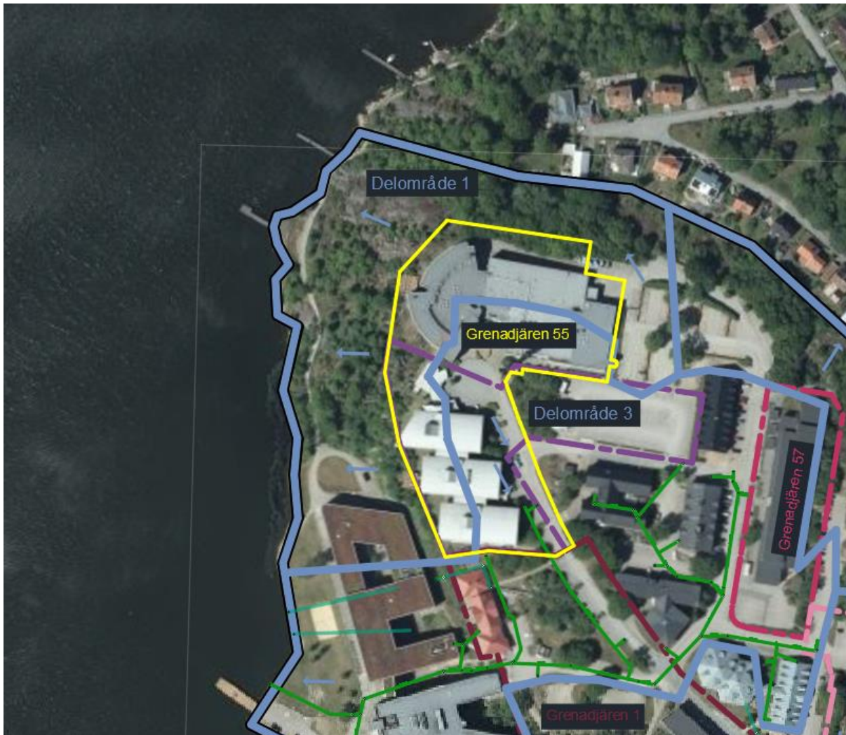
Figur 2. Avrinningsanalys. Blåa linjer anger delområdesgräns. (Norconsult,2022)

Avgränsningen för Grenadjären 55 m.fl har ändrats men den norra delen som tillkommer ingår redan i avrinningsanalysen i den befintliga dagvattenutredningen. Gräsvik bedöms vara indelat i fyra avrinningsområden (Norconsult, 2022). Två av dessa avrinningsområden ingår i Grenadjären 55 m.fl., delområde 3 (östra delen) och delområde 1 (västra delen), se Figur 2. Delområde 3 är påkopplat den kommunala dagvattenledningen längs Minervavägen som har utlopp i Danmarksfjärden. Det finns i dagsläget inga kapacitetsproblem på de kommunala dagvattenledningarna i området. Delområde 1 (norra delen) avleds ytledes västerut/norrut mot naturmark med diffus avrinning mot Danmarksfjärden. Det finns även två makadammagasin (fördröjning) på den västra sidan av den södra byggnaden (Minervavägen 13). Magasinens skick är okänd. Utöver den eventuella rening som sker i magasinerna sker ingen rening av dagvatten i området i befintlig situation. Figur 2 nedan visar utklipp från avrinningsanalysen. Se befintlig dagvattenutredning för mer ingående analys.