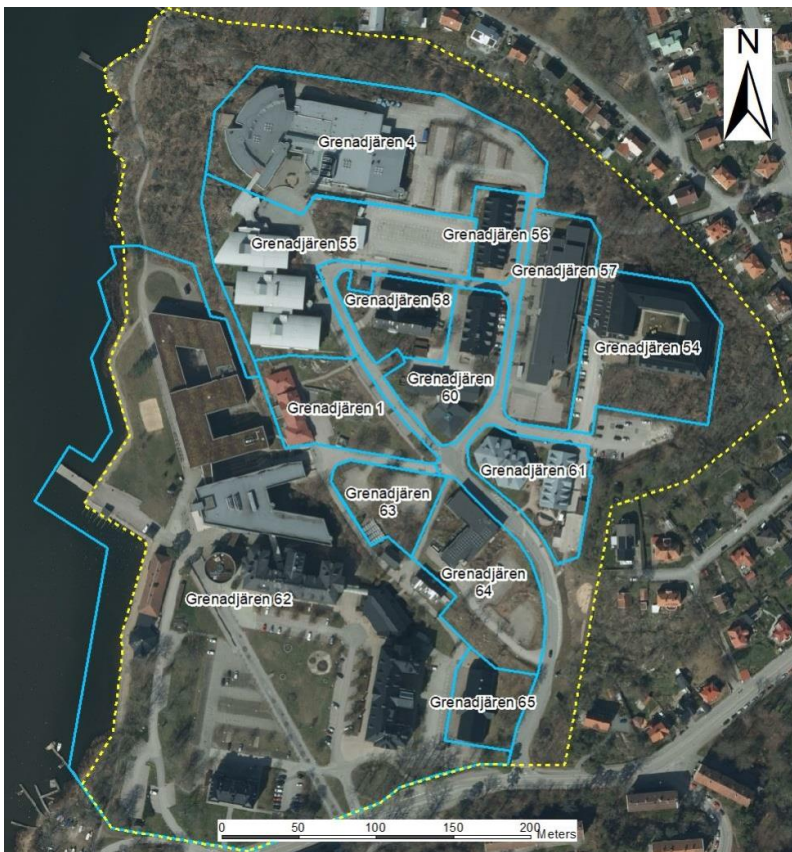
Figur 2. Utredningsområdet markeras med gul streckad linje. Enskilda fastigheter markeras med blå linjer.