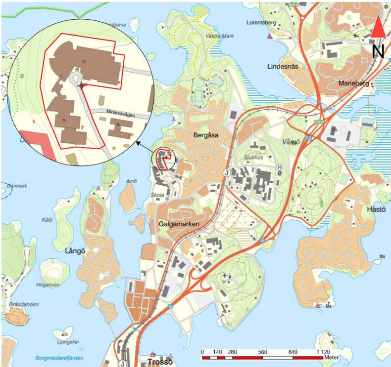
Figur 1. Aktuellt område för denna utredning markeras i rött, se inzoomad cirkel.