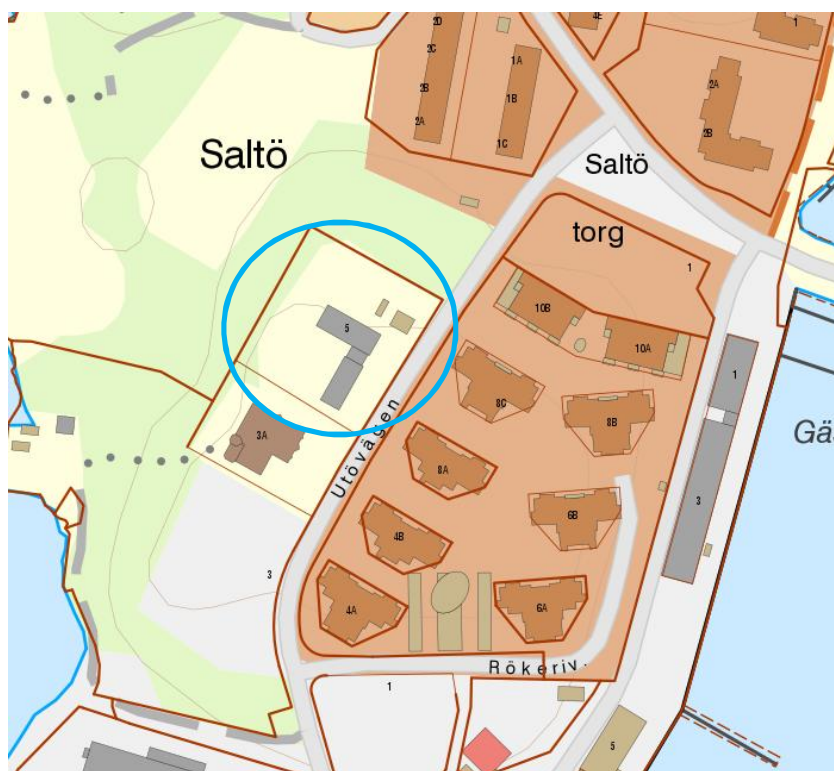
Figur 1. Berört område är markerat med blå ring.

Det aktuella området gränsar i norr och öster till bostadsbebyggelse, i söder till ett f.d. gjuteri samt i väster till ett naturområde.