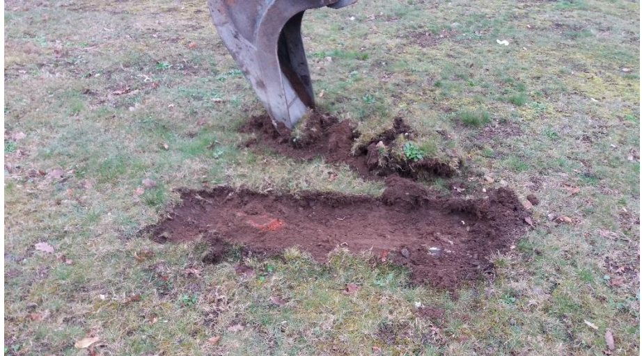
Figur 2. Tegelbot alldeles under grässkiktet i provpunkt 2017W01.

I provpunkt 2017W01 påträffades enstaka tegelbitar, se figur 2.