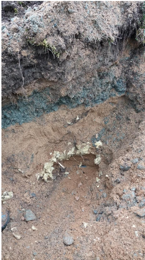
Figur 3. Kablage och isolering som påträffades i 2017W06a.

I provpunkt 2017W06a och b påträffades isolering och kablage, se figur 2.