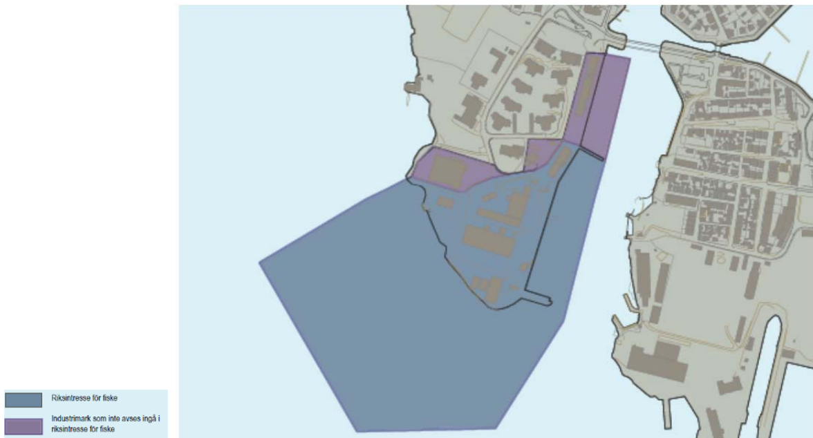
Bild 3. Karta från Fördjupning av översiktsplan för skärgården, där södra Saltö föreslås utvecklas så att nuvarande fiskerhamn till viss del kompletteras med andra stadsfunktioner så som boende, kontor och grönska. Blått område utgörs

I fördjupning av översiktsplan för skärgården från 2014 föreslås att södra Saltö utvecklas så att nuvarande fiskehamn till viss del kompletteras med andra stadsfunktioner. Boende och stadsutveckling föreslås ske uppe på höjden och längs västra stranden, medan södra uddens plåtå bibehålls för fiskets intressen. Fastigheten Sillen 2 avses inte ingå i riksintresset för fisket och fastigheten kan därmed bli aktuell att inrymma i föreslaget utvecklingsområde.