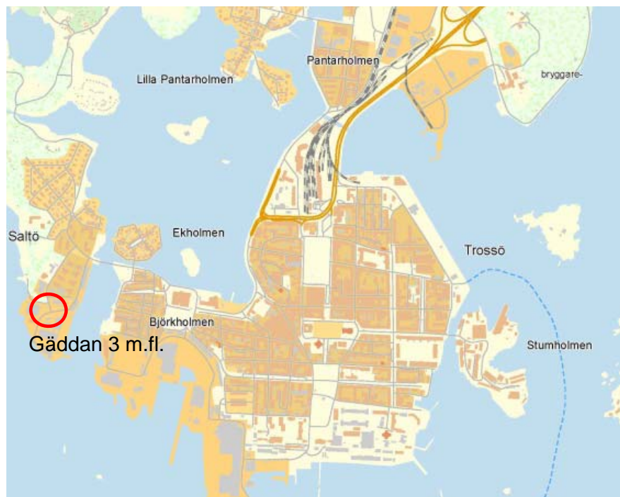
Bild 1. Översiktskarta med ungefärligt planområde.

Gäddan 3 och Sillen 2 är privatägd medan Sillen 2, Saltö 2:1 och Karlskrona 2:1 ägs av Karlskrona kommun.