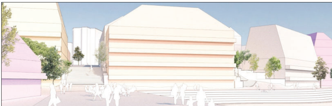
Bild 2. Föreslagna bebyggelse inom planområdet sett från kajstråket utmed vattnet.

Inom Sillen 2 och 3 har markanvändningen vård utgått och markanvändningen centrum har specificering till att ej omfatta samlingslokaler. Höjden inom de övre plåtåerna har justerats till 2-3 våningar, nockhöjden inom Sillen har justerats, sadeltak har tillkommit på de övre plåtåerna, anläggningar som plank etc. får inte tillkomma inom siktstråken, prickmarken får underbyggas med garage, värdefulla träd ska bevaras, fler skyddsbestämmelser angående ventilation kopplat till riskutredningen och isverket, ytterligare en planbestämmelse för att säkerställa en variation av bebyggelsehöjderna på högre plåtåerna samt utökad lovplikt för trädfällning.