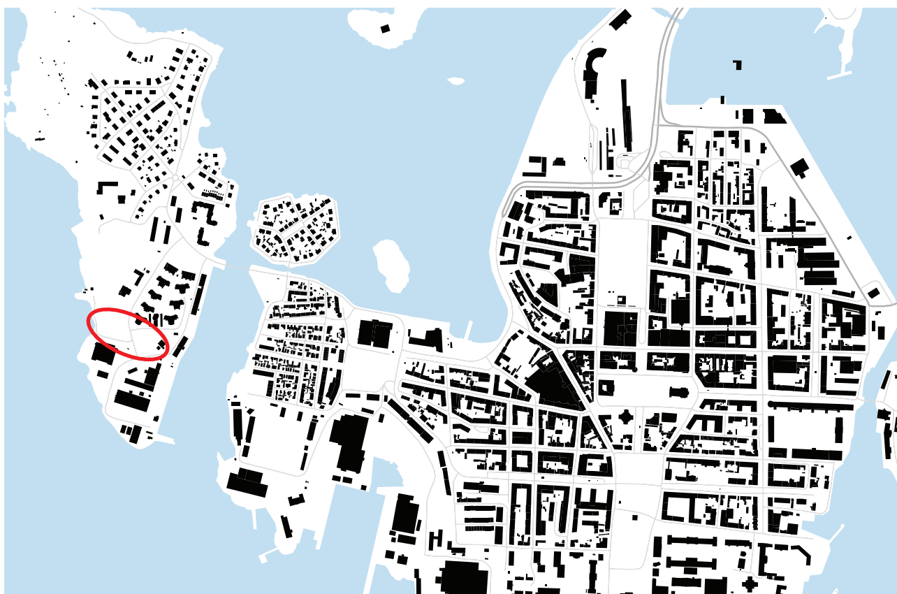
Bild 1. Översiktsskarta med ungefärligt planområde

Du har fått detta för att du bor, är taxerad/lagfaren ägare till någon fastighet som anses berörd av förslaget, är ägare/delägare/ innehavare av servitut inom eller i anslutning till planområdet, eller är en berörd myndighet/kommun/organisation. Även övriga som anses ha ett väsentligt intresse av förslaget har fått det för samråd.