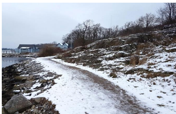
Figur 2. Foton från Gäddan.

Inom Sillen 2 och 3 finns en plan yta närmast Rökerivägen. I söder sluttar markytan brant ned mot Utövägen. Inom Sillen 2 finns några byggnader, en före detta pumpstation och en transformatorstation. Inom Sillen 3 har en numera riven industribyggnad funnits.