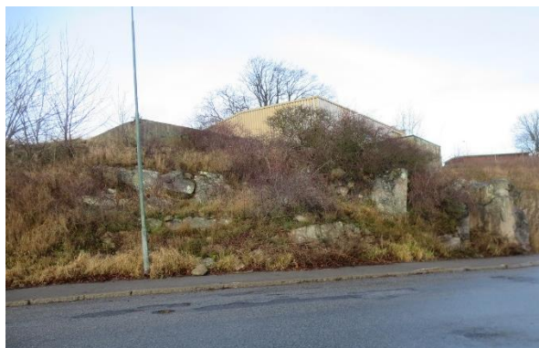
Figur 3. Foton från Sillen.