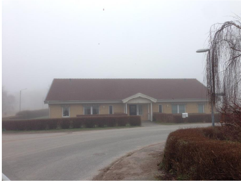
Bild 1. Befintlig byggnad