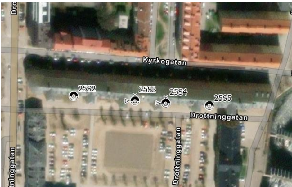
Figur 3. Provtagningspunkterna. Prov från punkterna 25S2, 25S3 och 25S4 är analyserade.

Två grundvattenrör installerades (Sweco, 2025a). Rören lodades vid två tillfällen i februari 2025 och vid ett tillfälle i mars 2025. I februari noterades inget grundvatten. I mars noterades grundvatten men i så liten mängd att det inte bedömdes vara möjligt att utta representativa grundvattenprov.