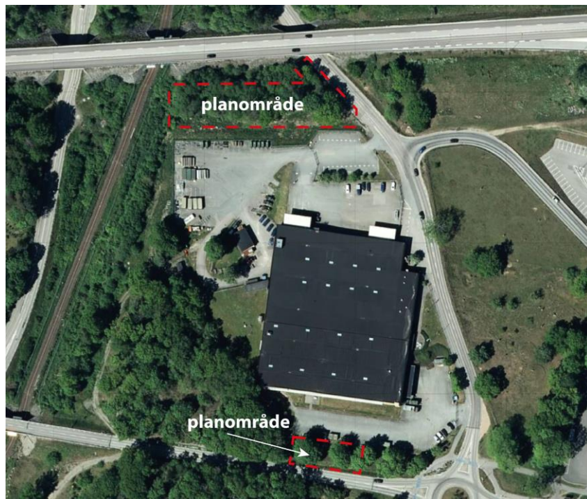
Bild 2. Karta med planområdets avgränsning