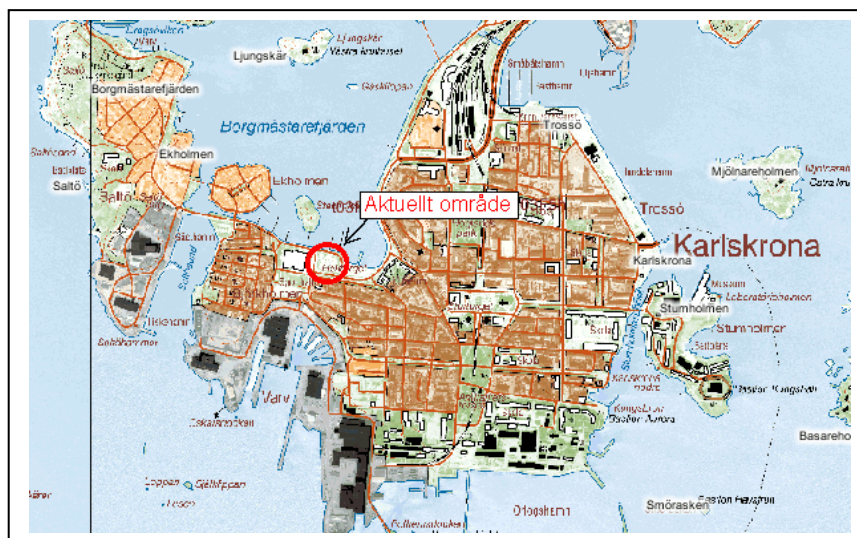
Figur 1. Översikt, lokalisering Kv. Axel

Grundvattenytan ligger normalt ungefär på samma nivå som medelvattenytan i havet (Borgmästarefjärden), dvs. på nivån +105,5. Vid hög- och lågvattenstånd påverkas grundvattenytan relativt snabbt, åtminstone för den norra delen av området närmast havet.