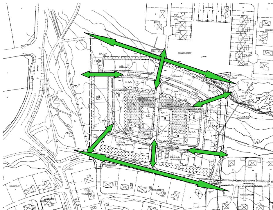
Kartan visar allmänhetens möjligheter till passage genom/förbi området efter förslagets genomförande (gröna pilar). Värt att notera är anläggandet av gångbana längs Västra Gärdesvägen.