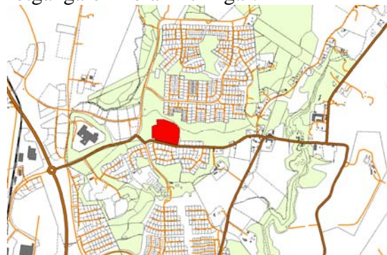
Kartan visar områdets placering i en förbindelselänk mellan två gröna områden.

Den föreslagna utformningen är framtagen med hänsyn till ovanstående råd och avser beakta samtliga punkter.