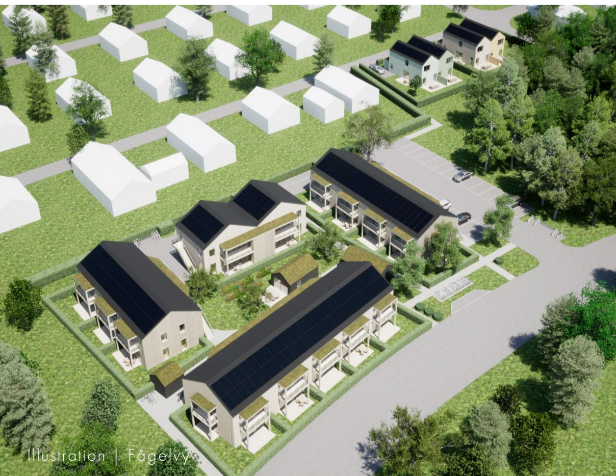
Illustration | Fågelvy

Galte Grytas hållbarhetskoncept bygger på att det inte är en enskild stor åtgärd som skapar ett hållbart bostadsområde. Istället är det de många mindre åtgärderna som tillsammans skapar en helhet som täcker in flera olika aspekter, både socialt, ekologiskt och ekonomiskt. Följande punkter är implementerade i detta förslag.