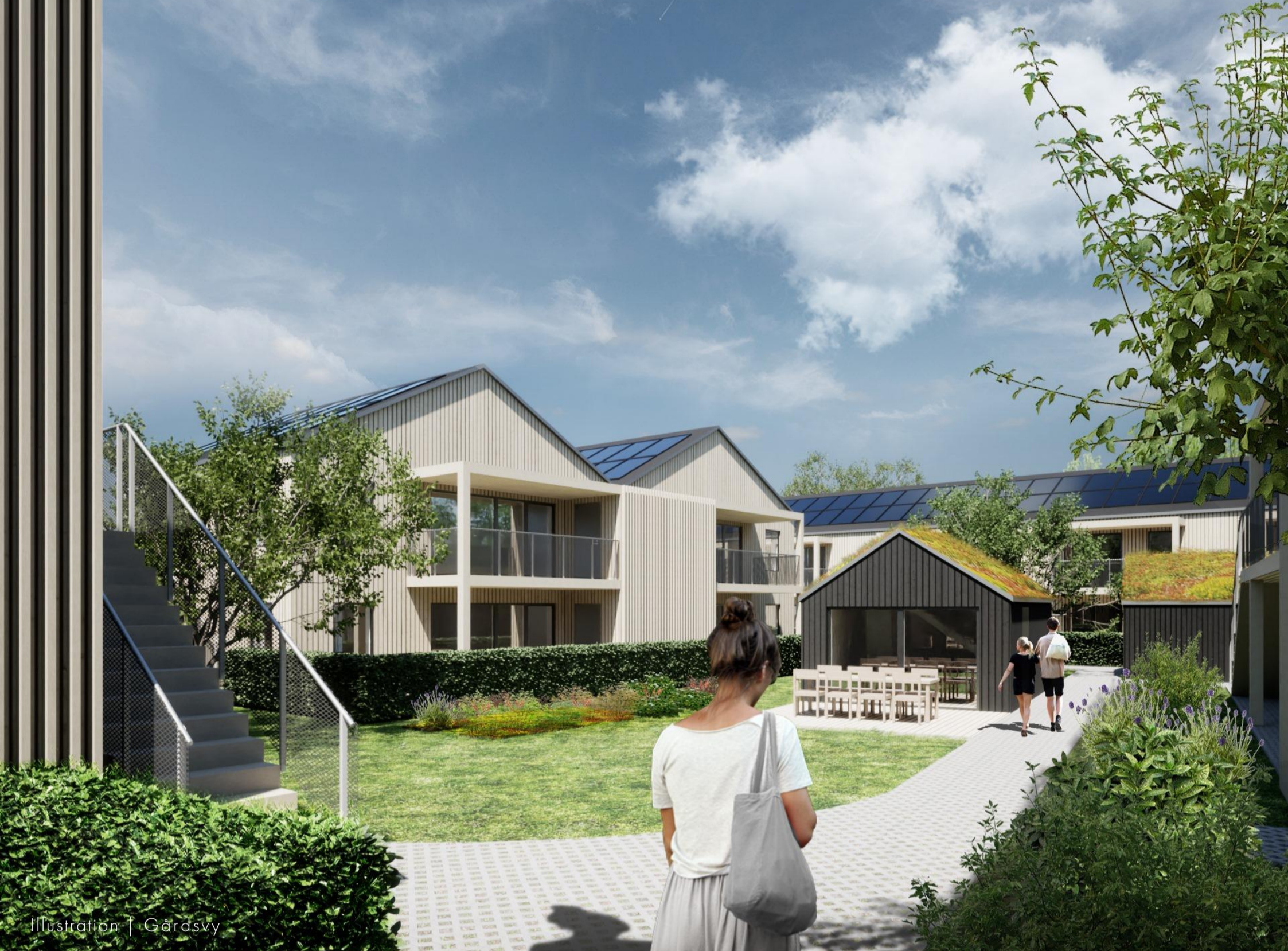
Illustration | Gärdsvy