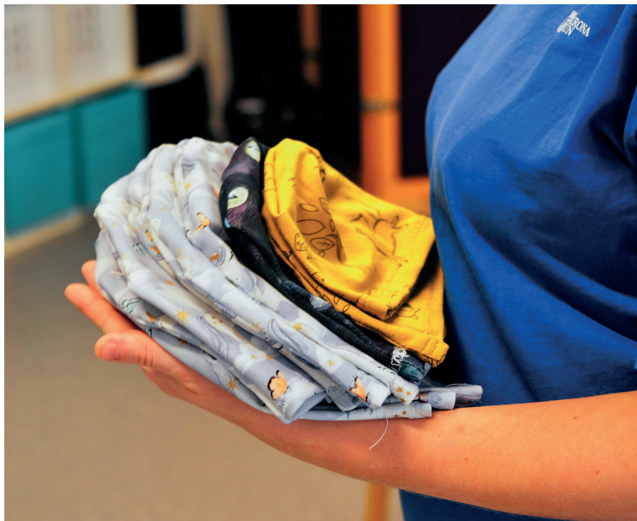
Barnmössor som är tillverkade på en av kommunens dagliga verksamheter.

Om din ansökan inte beviljas har du rätt att överklaga beslutet.