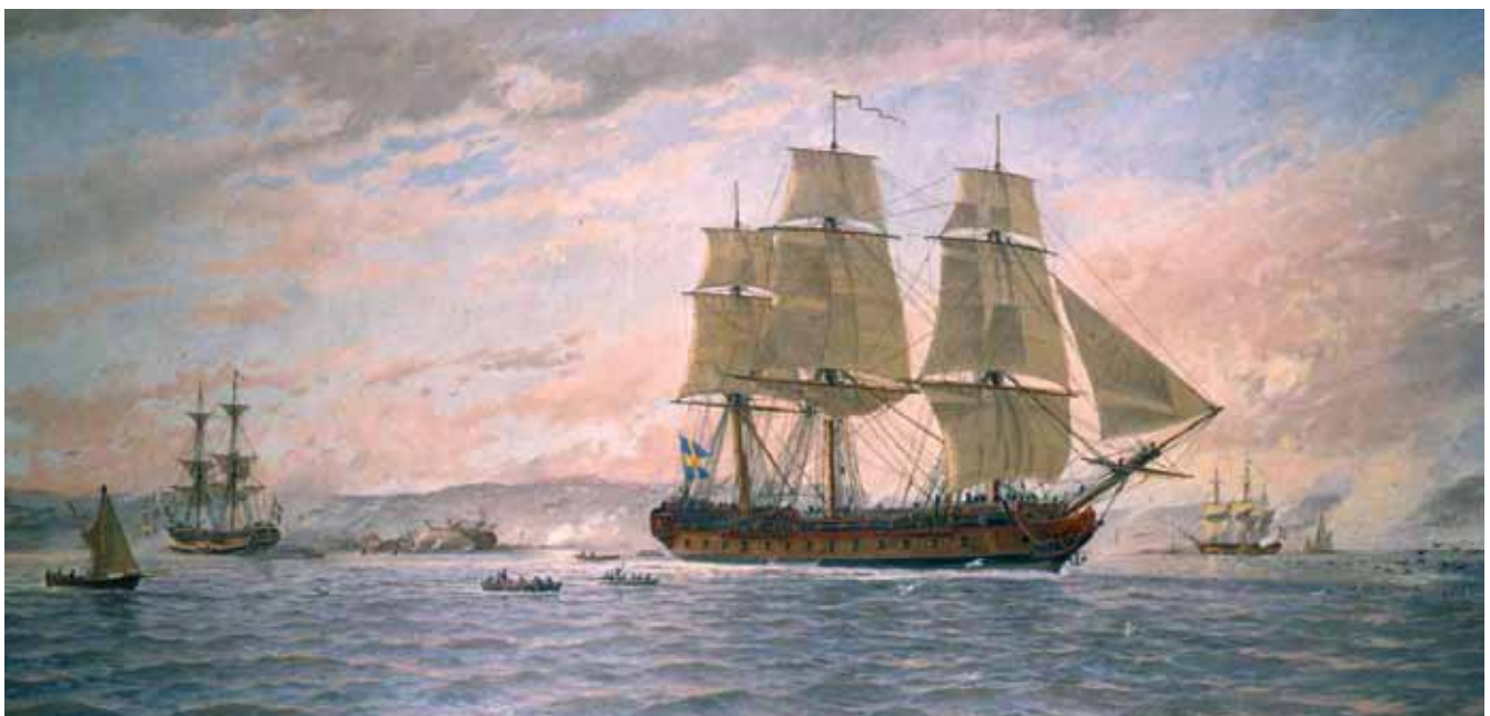
Linjeskeppet Wasa, Jacob Hägg 1921, Sjöfartsmuseet Akvariet, Göteborg.