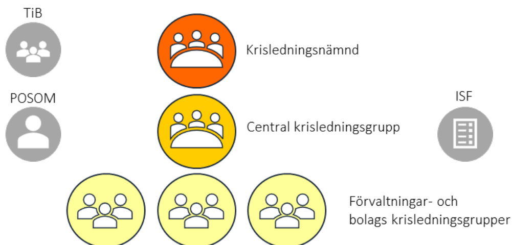
Figur 2. Karlskrona kommuns krishanteringsorganisation