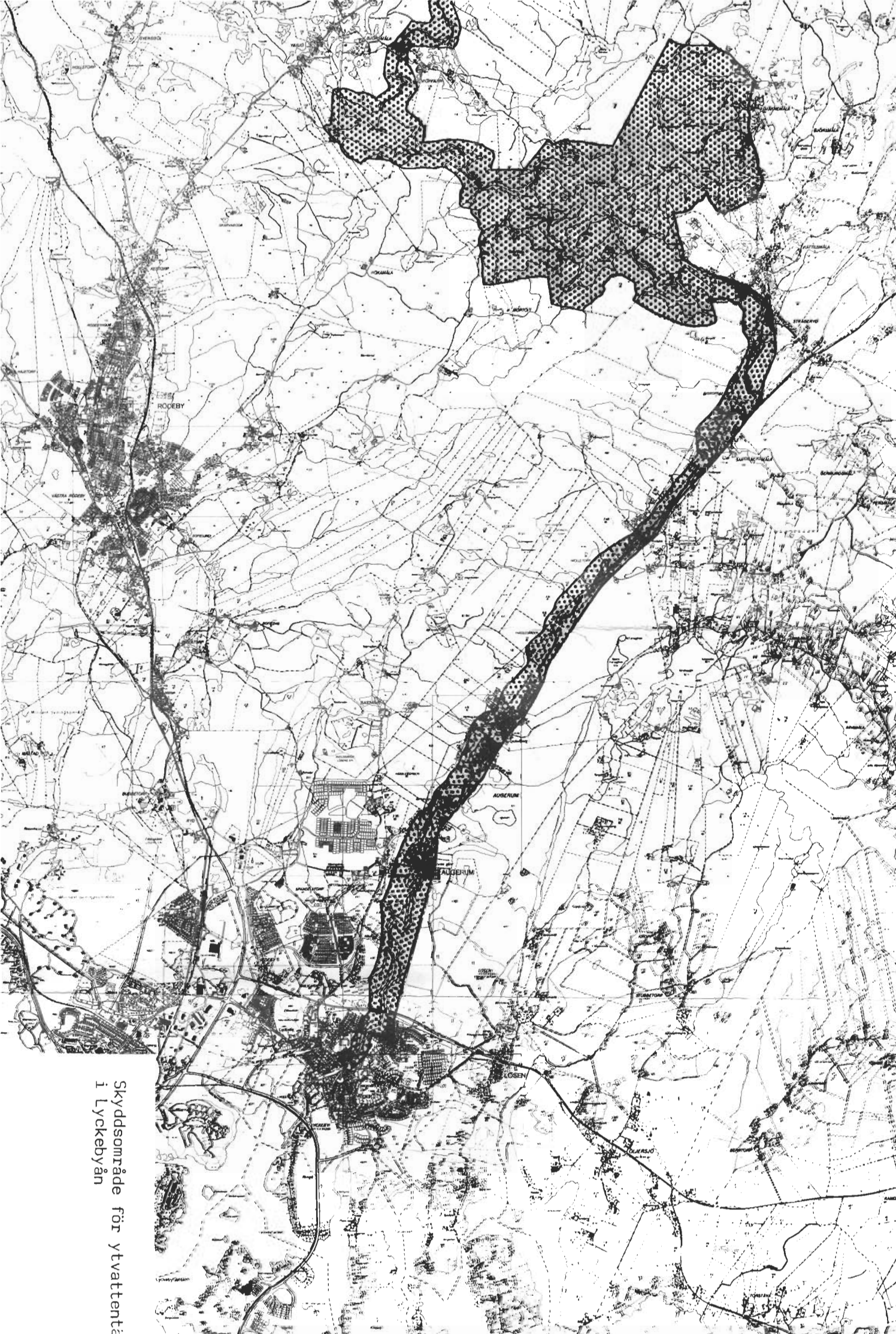
Skyddsområde för ytvattentäkt i Lyckebyån