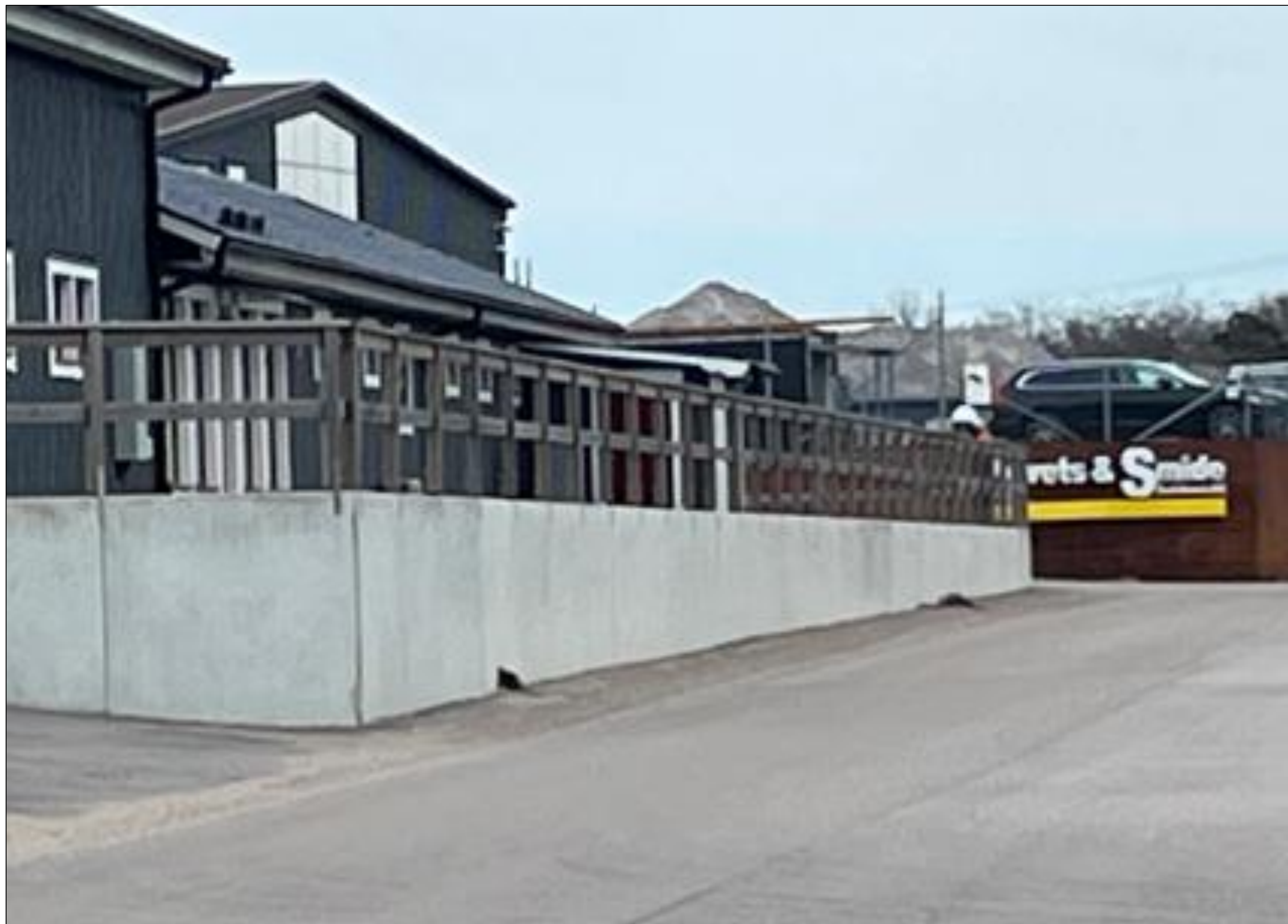
MOTSVARANDE MUR PÅ GRANNFASTIGHETEN (FILEN 1)