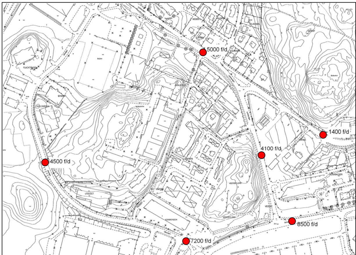
Bild 1. Dagens trafikflöde

På det mer övergripande vägnätet trafikeras Järavägen av 4500 fordon/dygn och Stationsvägen öster om Lyckebyvägen av 8500 fordon/dygn. I närheten av cirkulationsplatsen på Stationsvägen trafikeras Järavägen av 7200 fordon/dygn.