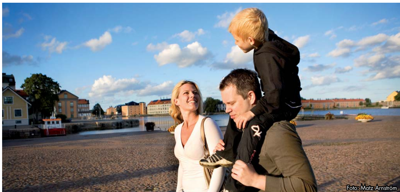
Kommunen strävar efter att erbjuda attraktiva miljöer för boende.

Dessa ledord är: förtätning, funktionsblandning, förbättrad kollektivtrafik, förnyelsebar energi, grönare stad, effektivare infrastruktur och levande landsbygd. Ledorden presenteras närmare i kapitlet Mark- och vattenanvändning