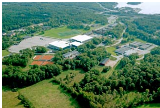
Rosenholmsområdet har stor potential att utvecklas.

med framför allt aktiviteter på Rosenholms udde. Satsningen på Rosenholm bidrar till att profilera kommunen i inriktning mot idrott och hälsa.