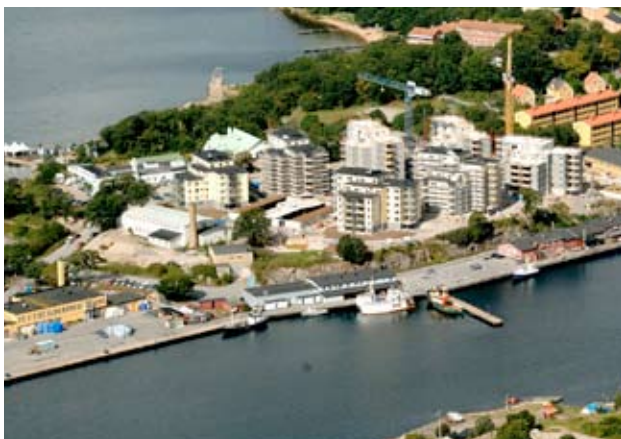
Fiskenäring och bostadsbyggande konkurrerar om ytorna på södra Saltö.

Riksintresset för yrkesfiske berör bland annat södra Saltö där fiskenäringen och bostadsbebyggelse idag konkurrerar om ytorna. Det har föranlett en översyn av fiskets nuläge och framtidsutsikter och hur olika intressen kan samexistera.