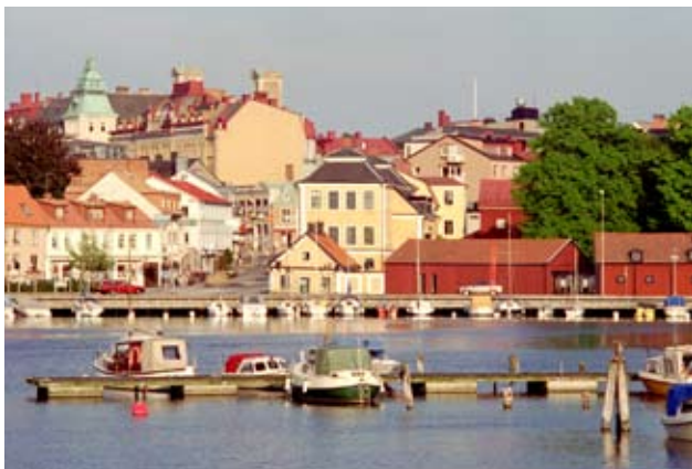
Borgmästarekajen på Trossö.

Stadsmiljöns kvaliteter prioriteras högt och gestaltning av det offentliga rummet stärker stadens identitet. Att komplettera bebyggelse i byar och samhällen kan även förstärka mindre tätorters identitet.