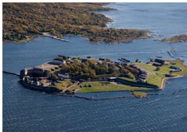
Kungsholms fort är en del av världsarvet.

Karlskrona präglas av sin marina historia och finns med på UNESCOs lista över världsarv. Planeringen av mark och vatten ska utvecklas tillsammans med ett levande världsarv.