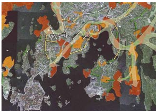
Ett utdrag ur Karlskrona kommuns grönstrukturplan.

Karlskrona kommun har under 2008 tagit fram ett förslag till grönstrukturplan som analyserar kommunens grönområden utifrån naturvärden, kulturvärden och rekreativa värden. Grönstrukturplanen är ett planeringsunderlag för översiktsplanen och ett viktigt instrument för kommunens utvecklingsstrategi. Tillgången till grönområden har stor betydelse för folkhälsa, god livsmiljö och den biologiska mångfalden.