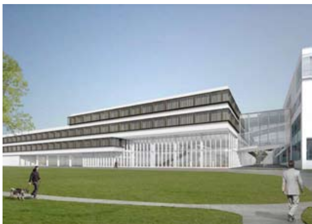
Blekinge Tekniska Högskolas huvudcampus ska från år 2010 lokalieras till Karlskrona.

Karlskrona har profilerat sig som en IT-kommun i samarbete med Blekinge Tekniska Högskola. Högskolan kommer från 2010 att lokalisera sitt huvudcampus till Karlskrona för att öka högskolans attraktivitet.