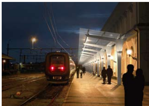
Spårbunden kollektivtrafik fyller en viktig funktion i kommunens utveckling.

Tågförbindelserna kustbanan, mellan Karlskrona och Köpenhamn, och kust-till-kustbanan, mellan Karlskrona och Emmaboda/Göteborg, är viktig för arbetspendlingen inom Blekinges kommuner och kopplingen till Köpenhamns flygplats Kastrup. En upprustning av kust-till-kustbanan är planerad till 2010 vilket kommer att bidra till minskade restider till bland annat Alvesta och stambanan.