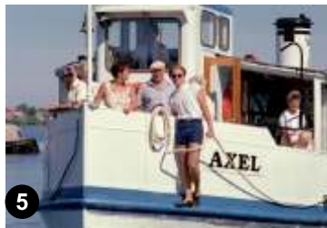
5. Båten Axel trafikerar Nättrabyån mellan Fisktorget i Karlskrona och Nättraby under sommaren juni - aug. 3-4 ggr /dag. www.blekingetrafiken.se/biljetter__priser/