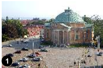
1. Karlskrona. Om du kommer norrifrån på din cykeltur kan du med fördel fortsätta på cykelbanan in till Karlskrona och besöka Världsarvet "Örlogsstaden Karlskrona". Leta dig upp till Stortorget och gå in i Tyska kyrkan och besökscentrum. Här får man en god överblick över vad och vilka byggnader som ingår i Världsarvet. www.karlskrona.se