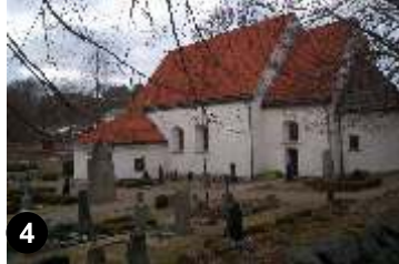
4. Nättraby kyrka, Blekinges äldsta kyrka, byggd på 1100-talet