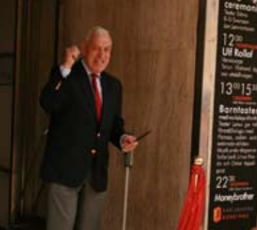
KG klippte till ordentligt.