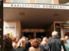
Många kom och fick träffa