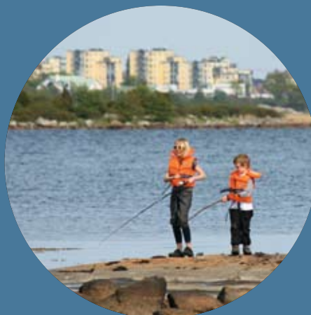
Marinmuseum på Stumholmen och fisketur i skärgården med Saliö i bakgrunden.

I Karlskrona finns dessutom naturen alltid närvarande genom skärgård, skog och mark inpå knuten. Välkommen att uppleva Karlskrona med oss.