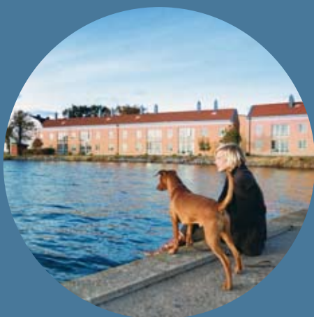
Bilder till vänster: Wasaskjulet och Polhemsdockan på Karlskronavarvet samt bostadsområdet Stumholmen.